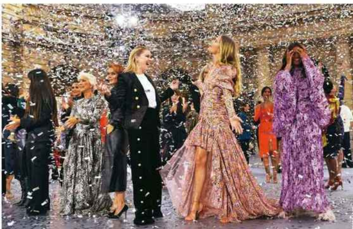
Ci-dessus, de g. à dr. : face à la tour Eiffel, Camila Cabello , Duckie Thot , Helen Mirren , Andie MacDowell , Eva Longoria et Amber Heard posent pour Gala . Ci-contre : à la Monnaie de Paris, Amber Heard , en Balmain , et Doutzen Kroes , en Rock , accueillent avec délectation une pluie de paillettes argentées.